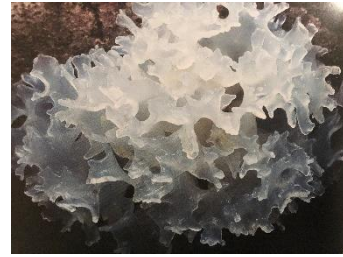
© Michael Lugner im Rambacher Wald